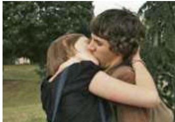
Jungs bleiben Jungs, Szenenbild

In den meisten Pubertätskomödien werden – oft schüchtern und verklemmt, aber sehr neugierig – gleich zwei unbekannte Kontinente erkundet: der eigene Körper und das andere Geschlecht. Auch in Jungs bleiben Jungs (Les Beaux Gosses, Riad Sattouf, Frankreich 2009) gehört es zum guten Ton, dass die Hauptfiguren sich ständig selbst befriedigen oder sich stundenlang im Spiegel mustern. Das Mädchen-Quartett aus Frontalknutschen (Angus, Thongs and Perfect Snogging, Gurinder Chadha, USA 2008) träumt hingegen noch züchtig von Knutschorgien und kugelt zuweilen kichernd durcheinander. Ansonsten gilt sein Interesse den technischen Aspekten des Küssens und der Art, wie Jungs so ticken. Für ersteres gibt es einen gleichaltrigen Nachhilfelehrer, der seine Dienste im Halbstundentakt anbietet und, findet jedenfalls die 14-jährige Georgia, in "Speichelstadt zu Hause ist". Für letzteres prägt Georgia den Begriff "boykind" und greift später auf den Klassiker unter den US-Ratgeberbüchern, John Grays Men are from Mars, Women are from Venus zurück. Die dort gewonnene Einsicht, dass Männer wie Gummibänder zu einem zurückschnellen, wenn man sie lang genug auf Distanz hält, führt allerdings nur dazu, dass Georgia ihrem Schwarm ihrerseits zum Rätsel wird. Am Ende steht die beruhigende Erkenntnis, dass man den unbekanntem Kontinent zwar nie vollständig, aber immerhin in ausreichendem Maße verstehen kann.