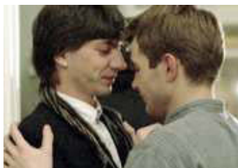
Coming Out

Insbesondere im Coming-Out-Drama wird die gesamte Gesellschaft zum repressiven Milieu. Rosa von Praunheim prangert in seinem Klassiker Nicht der Homosexuelle ist pervers, sondern die Gesellschaft, in der er lebt (BRD 1971) die Bundesrepublik der frühen 1970er-Jahre an; obwohl der berüchtigte § 175 StGB zwei Jahre vor Erscheinen des Films entschärft worden war, hielt die gesetzliche Sonderbehandlung von Homosexuellen (Stichwort: Schutzalter) an und spiegelte die ablehnende Grundstimmung innerhalb der Bevölkerung wider. In der DDR wurde der "Unzucht"-Paragraph (§ 151 StGB) bereits 1968 reformiert; trotzdem griff die DEFA das Thema mit Coming Out (Heiner Carow, DDR 1989) erst kurz vor dem Mauerfall auf. Bei Carow unterdrückt der Lehrer Philipp seine homosexuelle Neigung, lebt mit einer Frau zusammen und beginnt, als er sich in Matthias verliebt, aus Scham ein Doppelleben zu führen. Sexualpsychologisch lässt sich diese Form des späten Coming-Out vielleicht als zweite Pubertät bezeichnen.